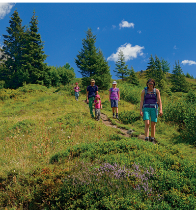
Naher der Sellflue werden die Tannen spärlich, dann auch die Heidelbeeren.

Sewenhütte, 041 885 18 72, www.sewenhuette.ch