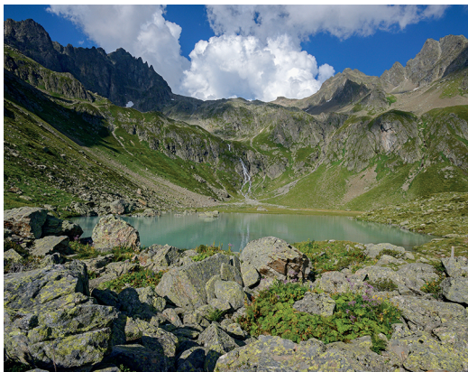
Das Seelein auf der Seewenalp lädt zum Verweilen ein. Bilder: natur-welten.ch