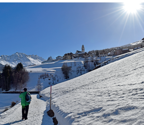
Unterwegs zwischen Salouf und Riom: die Sonne im Gesicht.