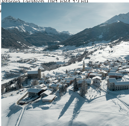
Das beschauliche Bergdorf Riom bietet die Kulisse für das Kulturfestival Origen.