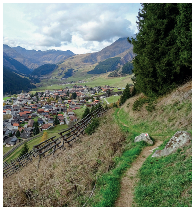
Presque à l'arrivée : au-dessus de Disentis, avec vue sur le col de l'Oberalp.