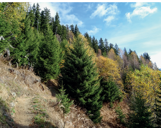
Depuis l'ouragan, des feuillus poussent entre les épicéas, rendant la forêt plus diversifiée et plus stable.

Erreichbar ist Sedrun mit dem Zug. Rückreise mit dem Zug von Disentis/Mustér.