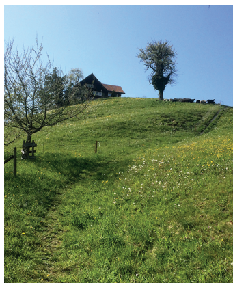
Wandern im Kanton Appenzell Ausserrhoden: hügelige Landschaften.