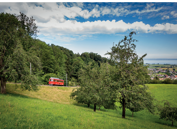
Die Wanderung beginnt mit der Fahrt auf der Bahn von Rheineck nach Walzenhausen.

Wirtschaft Rütegg, Oberegg, 071 888 15 56, www.ruetegg.ch