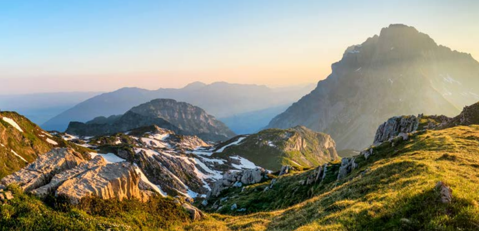
Morgenlicht beim Rotärd-Pass. Rechts der Mürtschenstock.