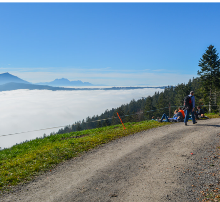
Rast über dem Nebelmeer mit Blick auf die Rigi und den Pilatus.

Restaurant Raten, Montag Ruhetag, 041 750 22 50, www.restaurant-raten.ch