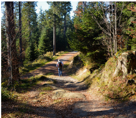
Der Ägeritaler Panoramaweg bietet wenige Aussichtspunkte, dafür einen tollen Wanderweg über die Muetegg.