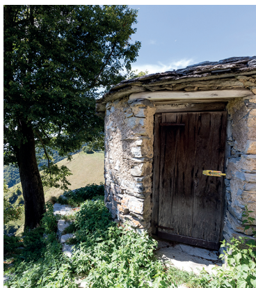
Ben mantenuta e aperta alle visite: la nevère sull'Alpe Nadigh.