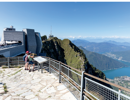
La migliore vista del Ticino dalle rocce su cui si erge il «Fiore di pietra» firmato Mario Botta.

Monte Generoso, 091 630 51 11, www.montegeneroso.ch