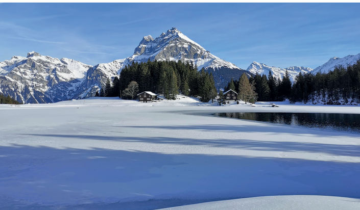
Am Arnisee, im Hintergrund die Windgällen.

Berggasthaus Alpenblick, Arni, 041 883 03 42, www.berggasthaus-alpenblick.ch Luftseilbahn Amsteg-Arnisee, 041 883 12 47, www.amsteg.arnisee.ch