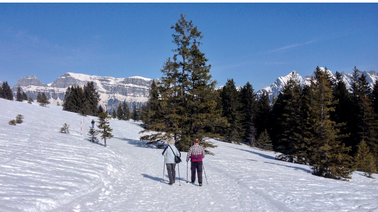
Sempre verso il panorama. Il sentiero escursionistico invernale poco prima di Prodalp.

Bergrestaurant Prodalp, 081 733 27 23, www.prodalp.ch