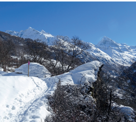
Im Aufstieg nach La Forclaz

Bei Lawinengefahr ist der obere Teil des Trails gesperrt. Infos bei Tourismus Val d'Hérens, Région Evylène, 027 283 40