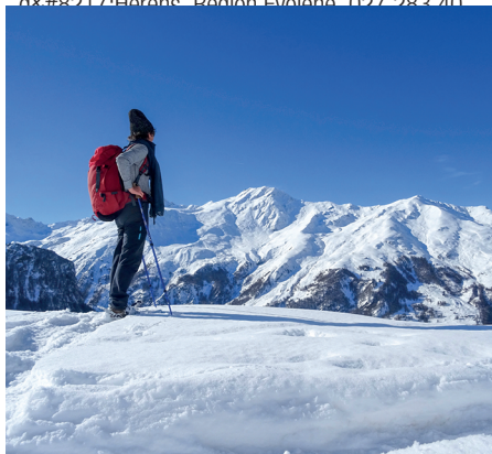
Aussicht zum Mont de l'Etoile und zur Palantse de la Cretta