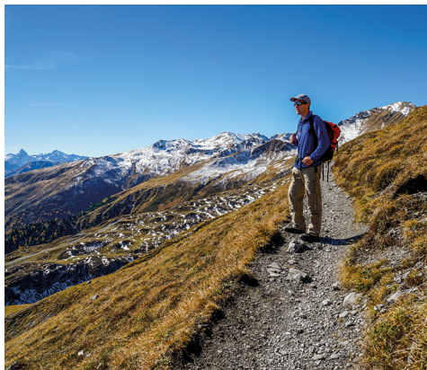
Peu avant le Col de la Strela avec, en toile de fond, le Piz Ela.