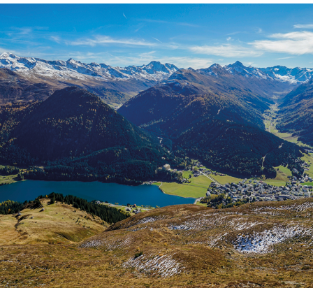
Le lac de Davos et la longue vallée du Dischmatal.

Auberge de montagne Parsennhütte, 081 416 36 52, www.parsennhuette.ch