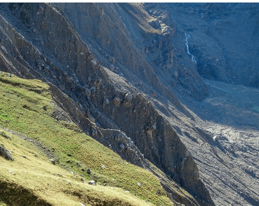
Die Moräne über dem Unteren Grindelwaldgletscher rutscht immer weiter ab.

Bergrestaurant Pfingstegg, 033 853 11 91, www.bergrestaurant-pfingstegg.ch Berghaus Bäregg, 079 121 09 09, www.baeregg.com