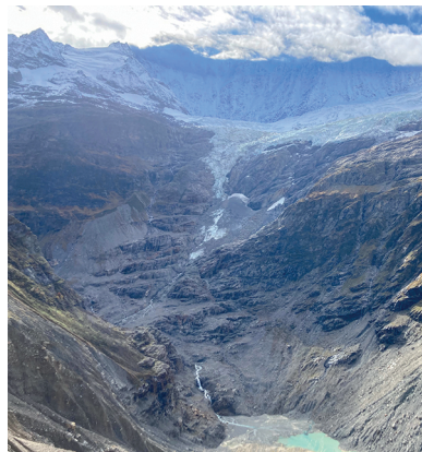
Die Fiescherhörner sind im Nebel versteckt. Der Gletscher zieht sich immer weiter zurück.