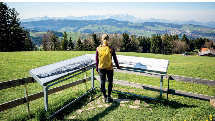
Was für eine Aussicht vom Kaienspitz. Der Alpstein mit dem Säntis ist noch tief im Winterschlaf.