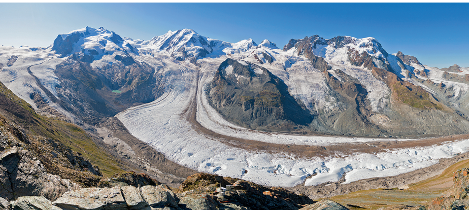
Überwältigend: Monte Rosa, Liskamm und Breithorn mit ihren Gletschern. Der mächtige Arm in der Mitte ist der Grenzletscher, links befindet sich der Gornergletscher.

Kulmhotel Gornergrat, 027 966 64 00, www.gornergrat-kulm.ch