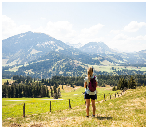
An klaren Tagen ist die Sicht unschlagbar.