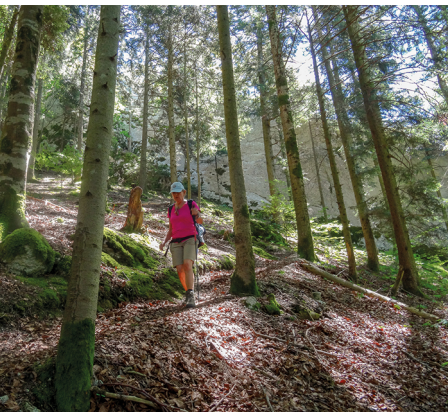
Manchmal geht es durch den Wald...

Erreichbar ist Bassecourt mit dem Zug von Biel oder Basel. Von Undervelier geht es mit dem Bus wieder zurück nach Bassecourt.