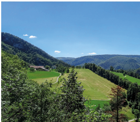
...aber bald geniesst man wieder hinreissende Aussichten.