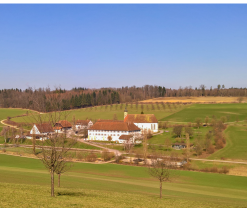
Das ehemalige Zisterzienserinnenkloster Olsberg.

Turmwirtschaft Aussichtsturm Schleifenberg (nur an Sonn- und Feiertagen), 061 921 13 38, www.aussichtsturm-liestal.ch Restaurant zur Stadtmühle, Liestal, 061 921 29 33, www.stadtmuehle-liestal.ch