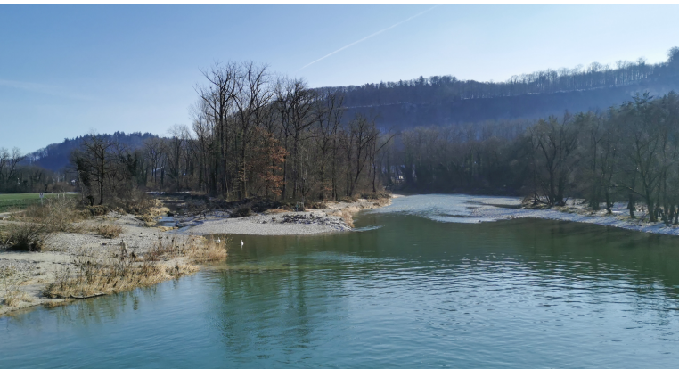
Beim Stauwehr Erlinsbach teilt sich die Aare in mehrere Arme.

Restaurant Brücke, Niedergösgen, 062 849 11 25, www.restaurant-bruecke.com