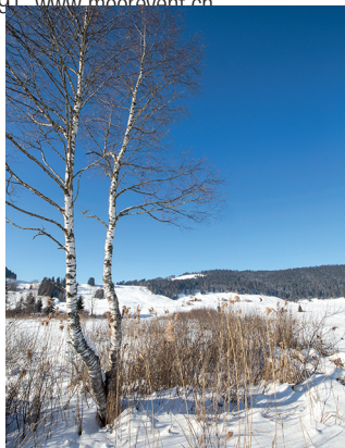
Die Wanderung führt über das grösste Hochmoor der Schweiz.