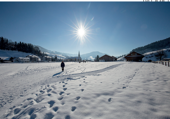
Von Rothenthurm führt ein Winterwanderweg nach Steinstoss.

Restaurant Steinstoss-Stubli, 041 838 12 94, www.raten.ch/steinstoss-stuebli Café Turm, 041 838 15 65, www.cafeturm.ch Moorführungen und Events, Albert Marty-Gisler, 041 838 13 91, www.moorevent.ch