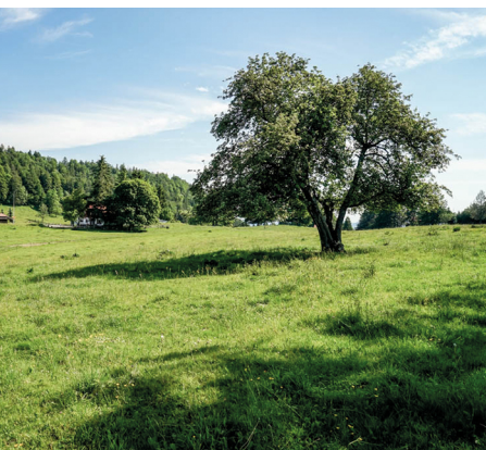
Auf der Hochebene Montagne de Moutier.

Café-Restaurant Le Soleil de Châtillon, Tel. 032 422 44 77, www.le-soleil-de-chatillon.ch