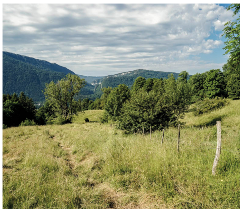
Oberhalb von Moutier. Im Hintergrund die Gorges de Court.