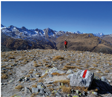
Passo d'Orsirora sul versante dell'Uri.