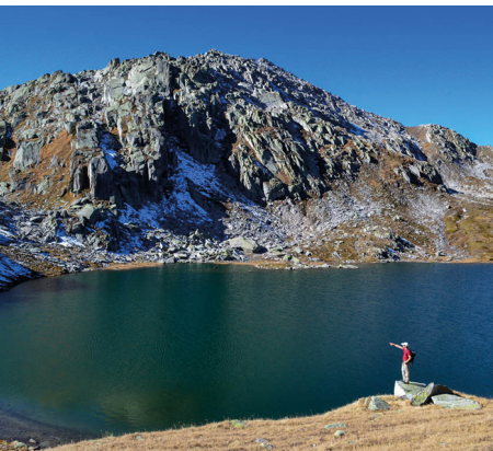
Uno dei limpidi specchi d'acqua tra i laghi della Valletta.

Il passo del San Gottardo è raggiungibile in autobus dalla stazione di Andermatt e Airolo. Ritorno dalla stazione di Realp.