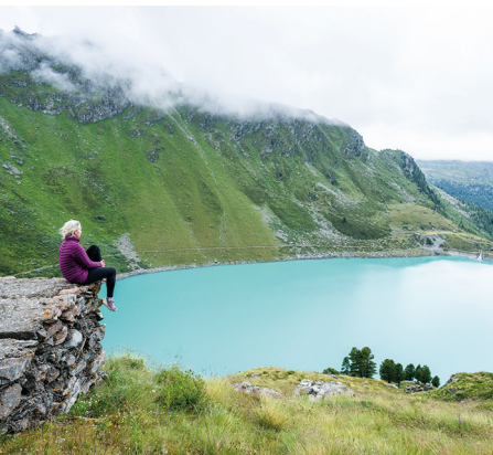
Kurz vor dem Abstieg noch einmal ein Blick auf den strahlenden See Lac de Cleuson

Erreichbar ist Siviez mit dem Bus ab Nendaz. Die Sesselbahn nach Combatzeline fährt nur bei gutem Wetter. In Siviez als auch in Combatzeline befinden sich diverse Einkehrmöglichkeiten, unterwegs sind keine vorhanden.