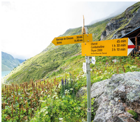
Genug Zeit, um die Aussicht zu geniessen.