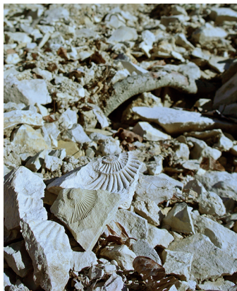
Mit etwas Glück findet man schöne Versteinerungen.