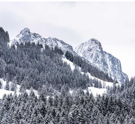
Hinter dunklen Wäldern grüssen die Mythen.

Erreichbar ist Sattel, Talstation Hochstuckli mit dem Zug von Biberbrugg oder dem Bus von Schwyz.