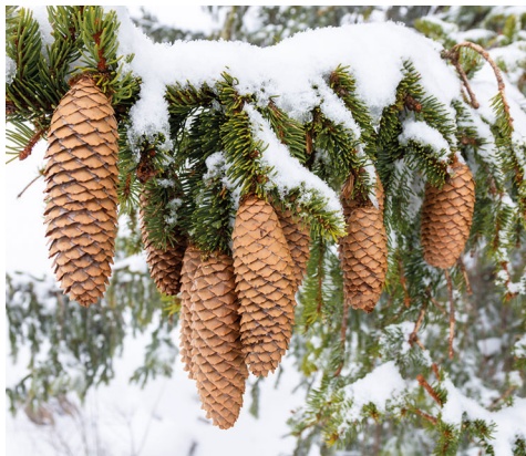
Ein schwer behangener Tannenast.