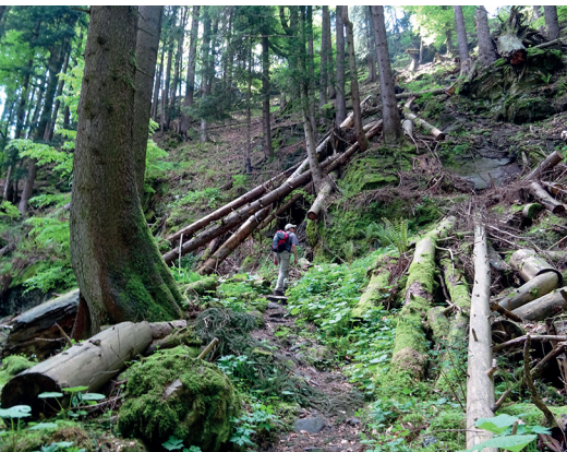
Am Fuss der Chrüzflue führt der Weg durch das Fallholz, das ein Sturm verursacht hat.

Restaurant Chemi-Hütte, St. Silvester, 026 418 11 05, www.chemi-huetta.ch Restaurant Edelweiss, Plasselb, 026 419 18 88, www.hotel-restaurant-edelweiss.ch