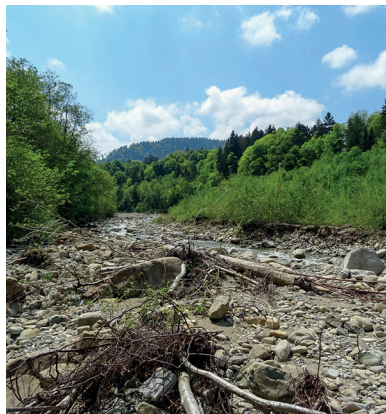
Die Ärgera kann bei starken Niederschlägen um ein Vielfaches anschwellen.