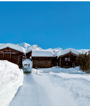
Alte, sonnengegerbte Holzhäuser prägen das Ortsbild von Zmutt.

Zermatt Tourismus, 027 966 81 00, www.zermatt.ch