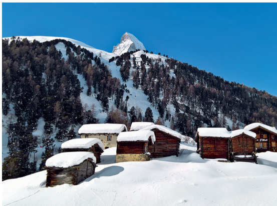
Beim Dörfchen Zmutt ist noch immer ein Zipfel des Matterhorns zu sehen.