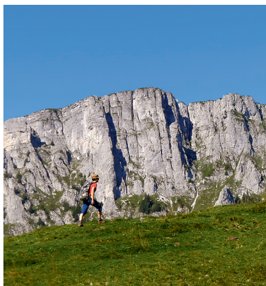
Wie eine Filmkulisse: die Felswand des Niderhore.