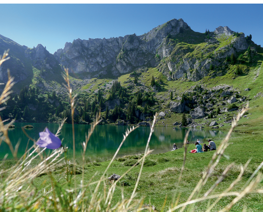
Ausruhen und Eindrücke aufsaugen am glasklaren Seebergsee.