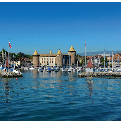
Il castello medioevale sul lago di Ginevra.

Morges e Alleman sono raggiungibili in treno da Losanna.