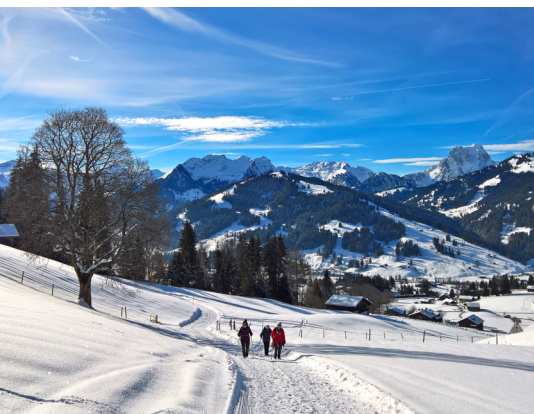
Aussichtreicher Abstieg nach Gruben. Der markante Gipfel rechts ist die Gummfluh.

Golfhotel Les Hauts de Gstaad, Saanenmöser, 033 748 68 68, www.golfhotel.ch Hotel Bernerhof, Gstaad, 033 748 88 44, www.bernerhof-gstaad.ch