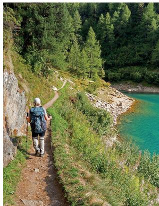
Ein Traum in Türkis: Das linke Ufer des Ritomsees.