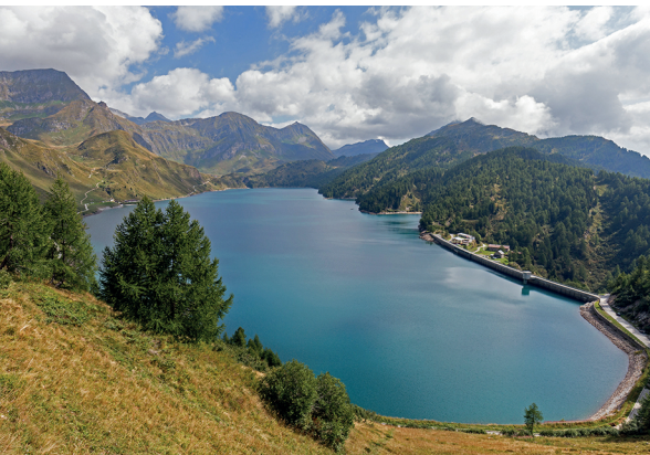
Der Ritomsee mit seiner Staumauer, die den SBB den Strom liefert.

Ritom-Standseilbahn und Gastbetriebe der Region, 091 868 31 51, www.ritom.ch Besichtigung Kraftwerk Ritom, www.sbb.ch/erleben