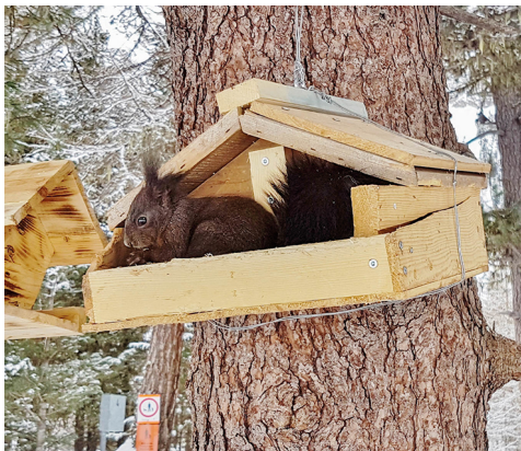
Wer etwas Zeit und Geduld hat, kann hier viele Tiere beobachten.