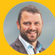
Simon Stadler PRÄSIDENT SCHWEIZER WANDERWEGE, NATIONALRAT

Freuen dürfen wir uns zudem über einen neuen Rekord der zugesprochenen Vermächtnisse. Auch die Einnahmen aus Gönnerschaften befanden sich 2023 auf einem Allzeithoch. Aufgrund der angespannten wirtschaftlichen und weltpolitischen Lage bedeutet dies ein ganz besonderes Bekenntnis unserer treuen Gönnerinnen und Gönner, denen unser Dank gebührt. Für die beständige Unterstützung danken wir auch dem Bundesamt für Strassen (ASTRA). Unsere Wertschätzung gilt ebenso den rund 2000 Ehrenamtlichen sowie den Mitarbeitenden der kantonalen Wanderweg-Fachorganisationen und des Dachverbands für ihren unermüdlichen Einsatz für ein einzigartiges Wanderwegnetz.